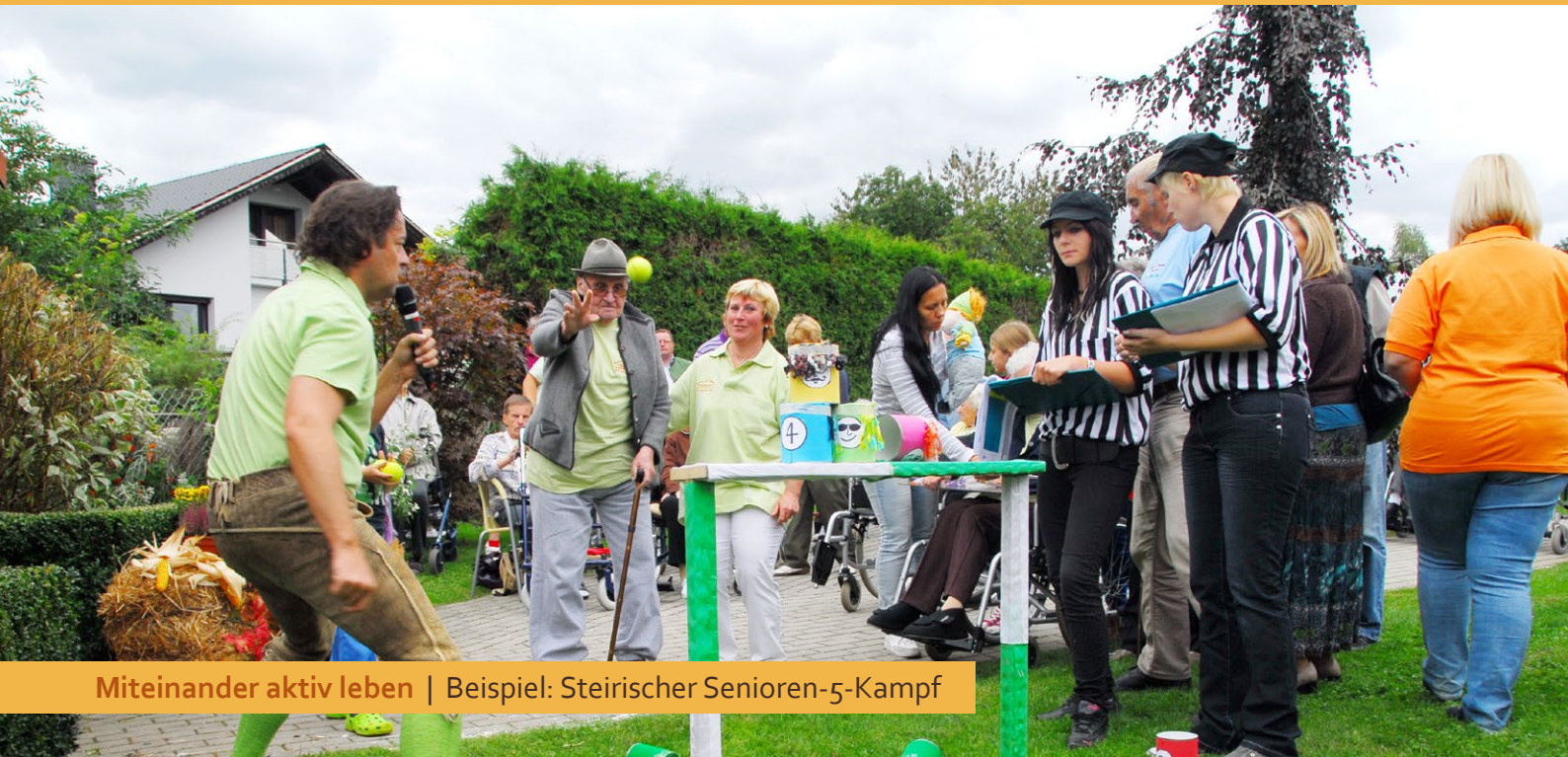
Miteinander aktiv leben | Beispiel: Steirischer Senioren-5-Kampf