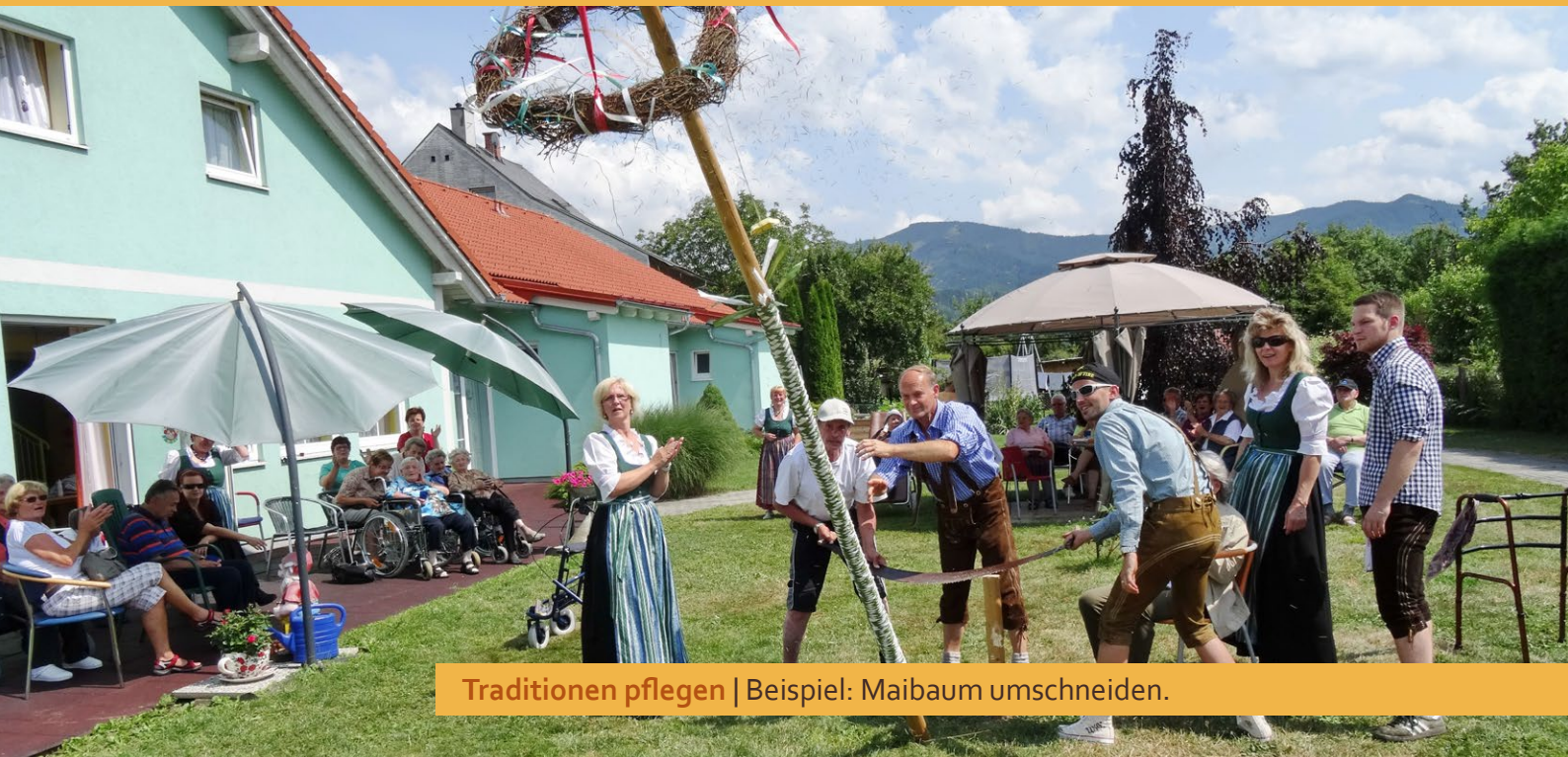
Traditionen pflegen | Beispiel: Maibaum umschneiden.